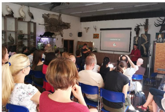
Přednáška Ukradená divočina pro úřady CITES MŽP