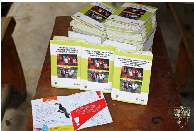
Natisknuté brožury pro farmáře ve třech jazycích

Práce anti-konfliktního týmu v předešlých letech vyústila ve vznik publikace s názvem „Jak svou farmu ochránit před zvířaty, a přitom je nechat žít“ (více informací ke vzniku brožury k nahlédnutí v tiskové zprávě zde ). V loňském roce bylo vytištěno 150 těchto brožur, které byly postupně distribuovány několika desítkám vybraných farmářů žijících v blízkosti lesů v několika vytipovaných oblastech. Brožury by díky mnoha užitečným tipům měly farmářům pomoci chránit jejich farmy před vstupem divokých zvířat a minimalizovat škody na úrodě, aniž by farmáři tato zvířata museli zabít. Brožury spolu s Kukang omalovánkami dostaly i děti farmářů, jelikož součástí brožury je vzdělávací část o biologii vybraných druhů živočichů a o ochraně ohrožených druhů žijících v blízkosti farem.