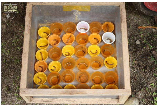
Larvy potěmníků před zakuklením