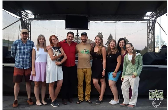
Český Kukang tým a slovenský rapper Suvereno

V Zoo Olomouc byly v několika pavilonech nainstalovány nové televize, kde jsou ve smyčce promítána videa o záchranném programu Kukang. Stejná videa jsou promítána také na obrazovkách v areálu Zoo Ostrava.