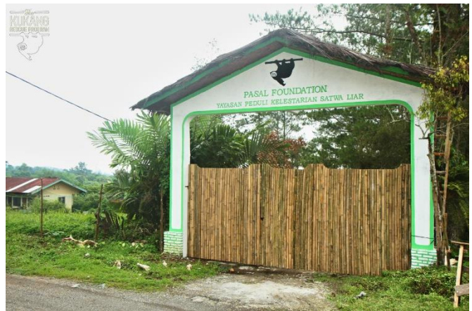
Nově postavená vjezdová brána