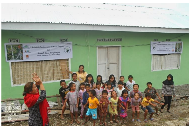
Pozdrav dětí z anglicko-environmentální školy

Všechny zmíněné aktivity by nebylo možné uskutečnit bez podpory našich partnerských zoologických zahrad Zoo Ostrava, Zoo Olomouc, Zoo Liberec, Zoo Hodonín a Zoo Wrocław, ale také dalších organizací, jako je například The Rufford Foundation, Česká koalice pro ochranu biodiverzity (CCBC), Koalice proti palmovému oleji, Neotáčej se zády, EAZA Prosimian TAG a mnoho dalších organizací, jejichž seznam je uveden na našich webových stránkách. V roce 2018 záchranný program Kukang získal podporu i od společnosti Cestovatelský obchod, hotelu Holiday Inn Prague Airport či wildlife fotografa Prokopa Pitharta. Všem mnohokrát děkujeme!