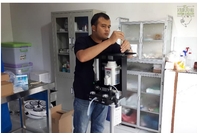
Instalace nové inhalační anestezie

Do kliniky záchraného a rehabilitačního centra již byla dovezena inhalační anestezie, na kterou byla v roce 2017 vyhlášena sbírka v rámci crowdfundingové kampaně . Klinika byla vybavena i novou speciální skříní a dalším drobným vybavením.