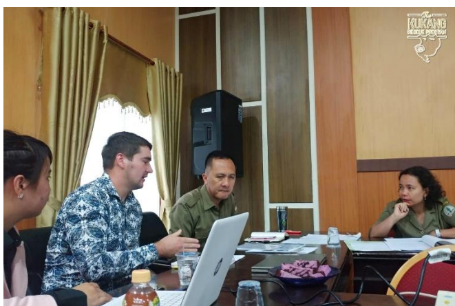
Jednání s vládní agenturou o spolupráci na ochraně