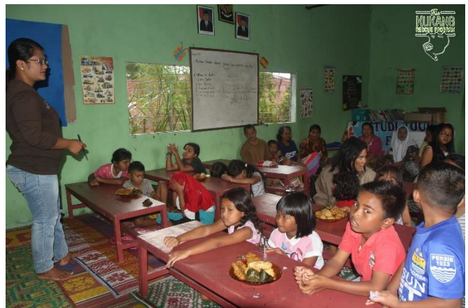
Rozdávání vysvědčení a ocenění nejlepších studentů