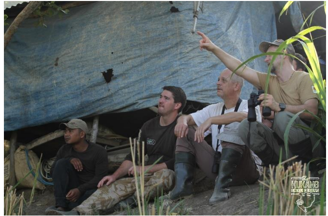
Návštěva z partnerských zoologických zahrad