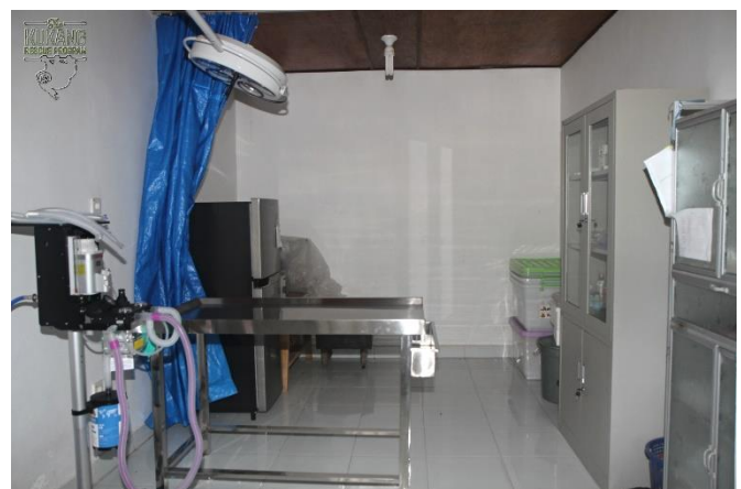
Vybavená klinika záchraného a rehabilitačního centra

V centru došlo i k dalším úpravám a vylepšením. Jedním takovým bylo vytvoření „odvodňovacího a biodiverzitého“ jezírka, které slouží jako bezpečné prostředí pro volně se vyskytující živočichy a rostliny a jehož cílem je přispět ke zvýšení biodiverzity celého záchraného a rehabilitačního centra, rozkládajícího se na ploše přibližně o velikosti 2,5 hektaru. Kromě bezpečného přístupu k vodě, možnosti úkrytu, potravy a prostoru k rozmnožování pro místní faunu zajišťuje toto jezírko i zadržování vody z podmačeného okolí. Toto „biodiverzitně-odvodňovací“ jezírko vzniklo před kanceláří v karanténny části centra. Za jezírkiem a kolem kliniky byly dále vybudovány i odvodňovací žlaby, které stahují vodu do dalších tůní v areálu. Kromě vytvoření zmíněného jezírka se od začátku vzniku centra systematicky rozvíjely i další aktivity přispívající ke zvýšení