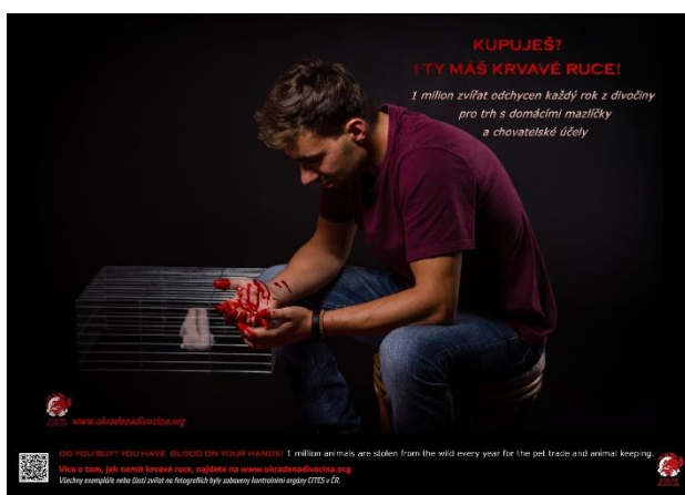
Ukradená divočina, krvavá verze – domácí mazlíčci

o odhadovaném rozsahu daného problému. Zajímavostí je, že všechny exempláře nebo části zvířat na fotografiích, jako je slonovina, nosorožčí rohy, kožešiny kočkovitých šelem, šupiny luskounů aj., byly zabaveny kontrolními orgány v České republice. Tyto panely jsou v elektronické podobě poskytovány všem zájemcům o tisk a vystavení v jejich instituci. Od spuštění kampaně byla Stezka či Výstava Ukradené divočiny realizována, je v tisku nebo se finišují její přípravy hned v 13 českých a slovenských zoologických zahradách, na několika školách, úřadech a dalších institucích. Záhy po svém spuštění kampaně získala záštitu Ministerstva životního prostředí v čele s 1. místopředsedou vlády a ministrem životního prostředí Richardem Brabcem. Spolupráce záchranného programu Kukang a Zoo Ostrava s Ministerstvem životního prostředí na tak důležitém tématu, jakým je ilegální obchod se zvířaty, navíc naplňuje jeden z vytyčených cílů Akčního plánu EU pro boj proti nezákonnému obchodu s volně žijícími druhy. Ukradená divočina vznikla na základě mnohaletých zkušeností vedoucí Oddělení mezinárodní ochrany biodiverzity a CITES České inspekce životního prostředí Pavly Říhové, ve spolupráci s ředitelem Zoo Ostrava Petrem Čolase, terénním zoologem Zoo Ostrava a ředitelem záchranného programu Kukang Františkem Příbrským, terénní zooložkou Zoo Olomouc a fotografkou Lucií Čižmářovou a dalšími členy týmu.