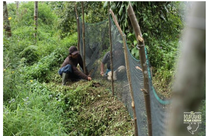
Oplocení záchraného a rehabilitačního centra