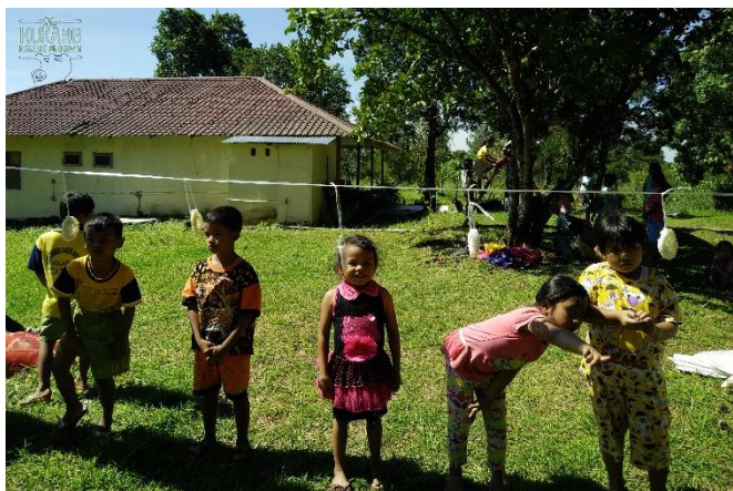
Děti slaví Den nezávislosti Indonésie v záchranném centru

Na Sumatře v průběhu roku proběhla prezentace o ilegálním obchodu se zvířaty, domácích mazlíčcích, ochraně outloňů a záchranném programu Kukang pro nové žáky ze zmíněné anglicko-environmentální školy či přednáška o ochraně luskounů a outloňů pro děti v mezinárodní škole v Medanu ( www.mismedan.org ). Pokračovalo se také v dalších osvětových aktivitách pro místní děti.