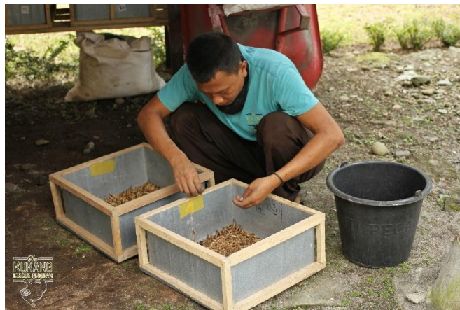
Sběr 14-denní produkce hmyzu