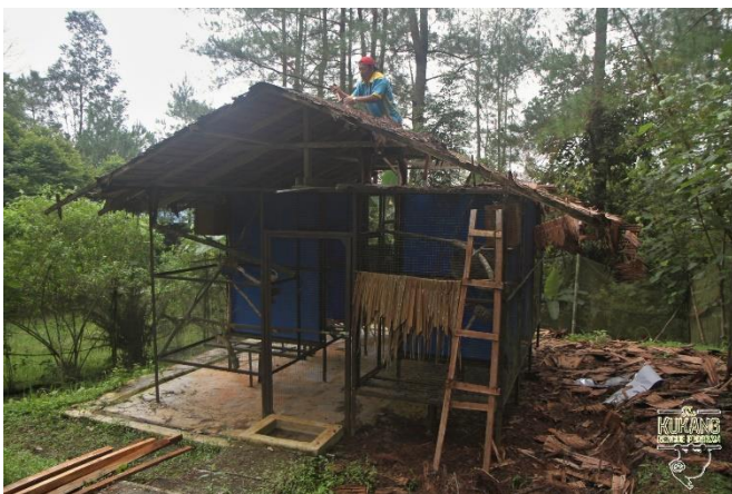
Výměna listové střechy karantény pro outloně