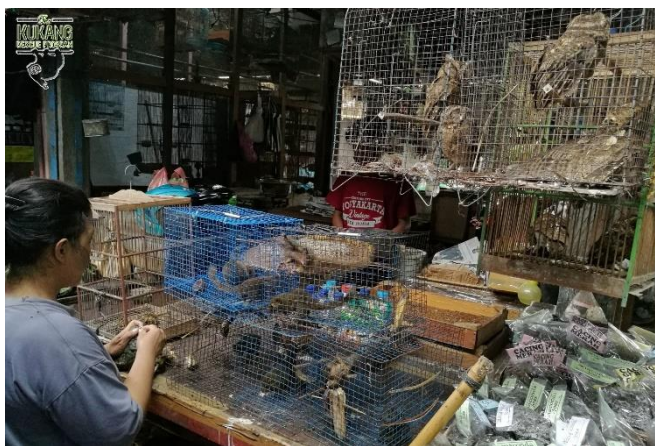
Trh se zvířaty Jatinegara, Jakarta

Všechny zmíněné aktivity by nebylo možné uskutečnit bez podpory našich partnerských zoologických zahrad Zoo Ostrava, Zoo Olomouc, Zoo Liberec, Zoo Hodonín a Zoo Wrocław, ale také dalších organizací, jako je například The Rufford Foundation, Česká koalice pro ochranu biodiverzity (CCBC), Koalice proti palmovému oleji, Neotáčej se zády, EAZA Prosimian TAG a mnoho dalších organizací, jejichž seznam je uveden na našich webových stránkách. V roce 2018 záchranný program Kukang získal podporu i od společnosti Cestovatelský obchod, hotelu Holiday Inn Prague Airport či wildlife fotografa Prokopa Pitharta. Všem mnohokrát děkujeme!