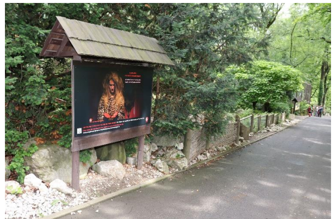
Jeden z panelů výstavy Ukradené divočiny

Dne 16. října navíc proběhlo druhé kolo focení nové série fotografií (autorkou je opět Lucie) zabývající se dalšími aktuálními evropskými tématy ohrožení divokých zvířat a ilegálním obchodem s nimi. Focení proběhlo opět v ateliéru SŠ oděvní a služeb Vizovice. Fotky procházejí v současnosti výběrem a úpravou a v roce 2019 budou zveřejněny.