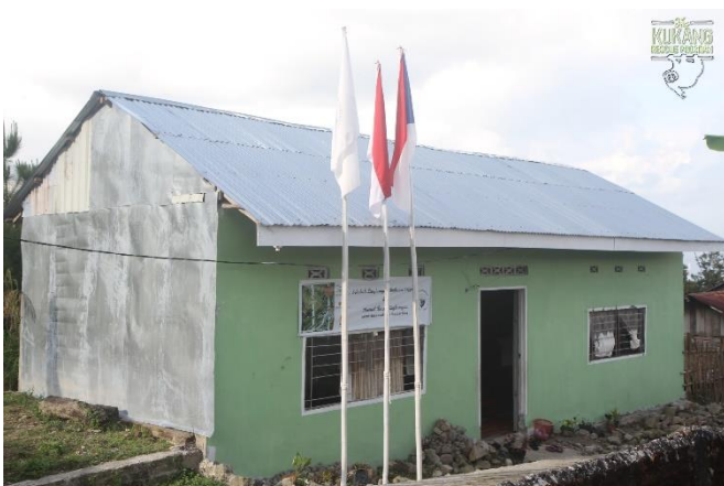
Nová budova anglicko-environmentální školy

Výuka v anglicko-environmentální škole se přesunula do budovy, která byla za tímto účelem nově postavena. Tato škola slouží zdarma dětem žijícím v blízkosti záchraného a rehabilitačního centra. Děti odpolední školu navštěvují třikrát týdně, z čehož dvakrát týdně se učí angličtinu a jednou environmentální výuku. Vždy na konci semestru se tradičně koná rozdávání vysvědčení a ocenění nejlepších studentů. Této slavnostní události se vždy účastní mimo studentů samotných také jejich rodiče, všechny učitelky a vedení naší indonéské nadace (dále už jen PASAL Foundation).