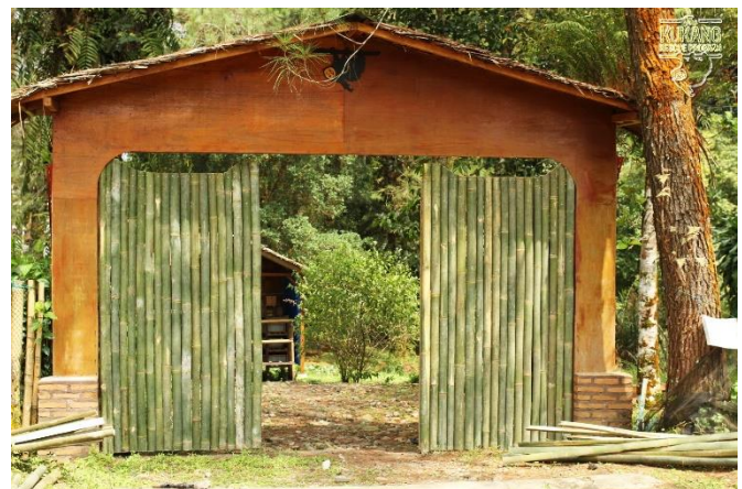
Nová vrata karanténny části

Do kliniky záchraného a rehabilitačního centra již byla dovezena inhalační anestezie, na kterou byla v roce 2017 vyhlášena sbírka v rámci crowdfundingové kampaně . Klinika byla vybavena i novou speciální skříní a dalším drobným vybavením.