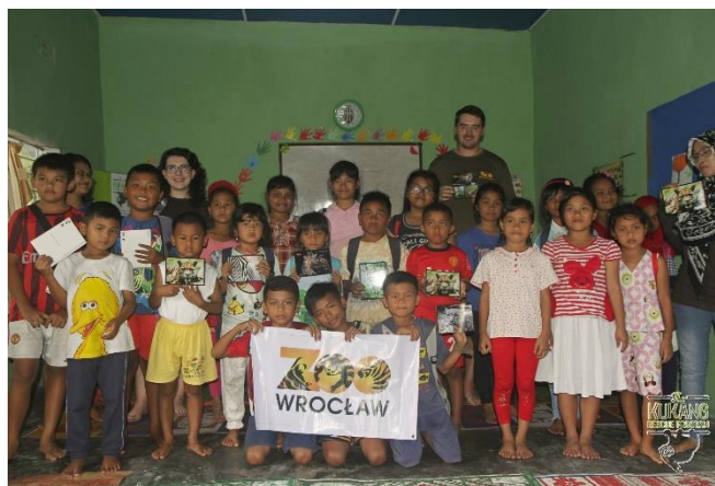
Děti ze školy s obrázky zvířat darovanými ze Zoo Wroclaw