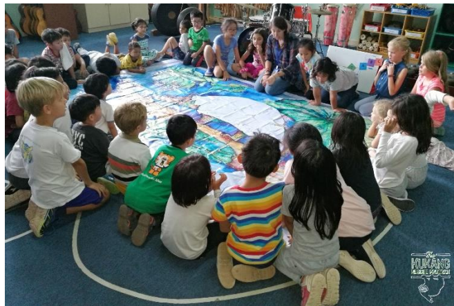
Výuka v mezinárodní škole v Medanu

Vedení záchranného programu Kukang se v prosinci vydalo na několik dní do Thajska na ostrov Phuket, kde se pokusilo zdokumentovat nabízení outloňů k vyfocení turistům. Phuket by měl být jedním z míst, kde k těmto nelegálním praktikám dochází nejčastěji. Proběhl každodenní monitoring míst, která jsou na internetu známá tím, že je tam možné narazit na Thajce s outloni (pláže Patong, Karon, Kata, ulice a centrum Patong, oblast kolem pláže Kata atd.). Na pláži Karon se povedlo během dne najít Thajku nabízející outloně k vyfocení. Z celého průzkumu bude v roce 2019 zveřejněno několik výstupů a s pořízeným materiálem se bude dále pracovat.