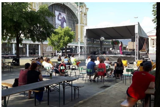
Přednáška na benefiční akci Sumatra v ohrožení

Podíl zoologických zahrad při environmentálním vzdělávání, výchově a osvětě (Zoo Ostrava), Ostrava (Ukradená divočina)