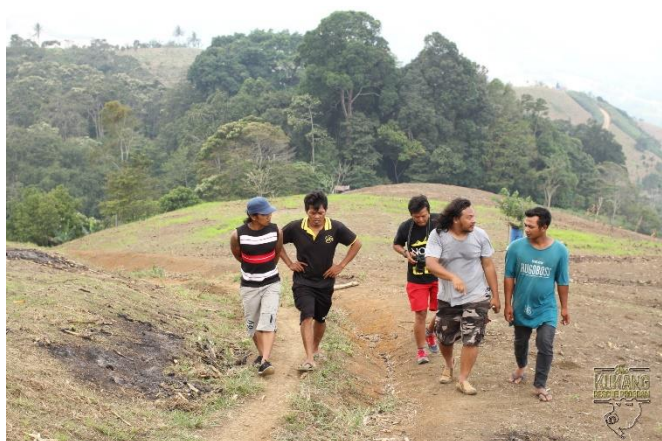
Návštěva týmu SwaraOwa v komunitě v Kuta Male

Záchranný program Kukang připravuje také rozšíření svých aktivit o projekt zaměřený na podporu produkce ekologicky šetrné Kukang kávy, jejíž distribuce bude podporovat farmáře z místní komunity a současně ochranu místních chráněných a ohrožených druhů zvířat. Na metodice produkce kávy, její distribuci a ochrannářských opatřeních spolupracujeme s další indonéskou nadací SwaraOwa, která na ostrově Jáva již několik let řídí projekt Coffee and Primate Conservation. Náš tým v roce 2018 navštívil základnu organizace SwaraOwa v Yogyakarta, kde se nachází její zpracovna a pražírna kávy. Naopak tým SwaraOwa navštívil naši komunitu v Kuta Male, kde plánujeme aktivity tohoto projektu realizovat. Kromě podpory místní komunity je cílem těchto aktivit ochrana veškeré fauny (vesnicí prosazovaný zákaz lovu zvířat vyjma divokých prasat) v oblasti Kuta Male a zabezpečení oblasti před tím, než dojde k pilotnímu vypuštění rehabilitovaných outloňů.