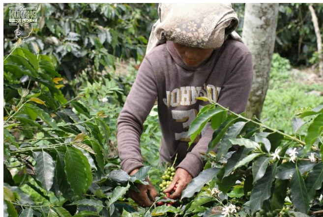
Produkce kávy ve vesnici Kuta Male

V rámci shánění finančních prostředků na realizaci našich aktivit na podporu vzdělávání a rozvoje místních komunit jsme zažádali o grant vypsany českým Ministerstvem zahraničních věcí, tzv. „Malý lokální projekt rozvojové pomoci“. Grantová žádost nese název „Support of three communities in northern Sumatra through environmental education, sustainable coffee production and endangered species conservation“ a její realizace proběhne v převážné většině roku 2019.