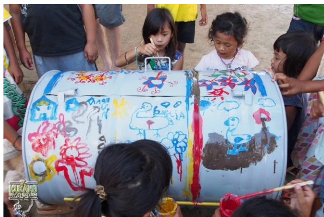
Společné zkrášlování sběrných košů na tříděný odpad