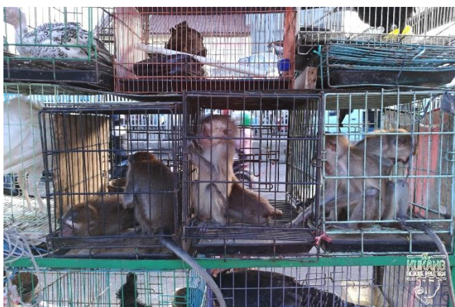
Makakové jávští a další savci na trhu se zvířaty v Jakartě

Tým záchranného programu Kukang v roce 2018 také provedl průzkum trhu se zvířaty na Jávě v Jakartě i na Sumatře v Medanu. Na těchto trzích je možné vidět kromě mnoha druhů ptáků také mnoho druhů savců i dalších zvířat. Tento průzkum však opět potvrdil to, že v současné době se outloni (ale i další druhy ohrožených druhů zvířat) na trzích v ulicích objevují jen zřídka a obchod se přesunul na internet, kde hrozí menší riziko dopadení obchodníků.