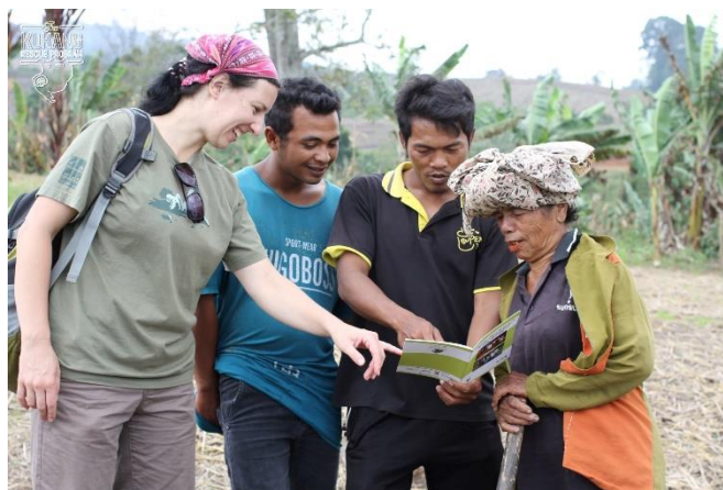
Anti-konfliktní tým rozdává brožury farmářům

V roce 2018 vznikla nová dohoda o spolupráci (MoU) mezi naší indonéskou nadací PASAL Foundation a vesnicí Kuta Male ohledně nového projektu pracovně nazvaného „Projekt třídění a redukce odpadu v Kuta Male“. Cílem projektu je snížit míru znečištění oblasti přiléhající k chráněnému území Gunung Leuser Ekosystem nastavením managementu nakládání s odpady právě ve vesnici Kuta Male (Karo regency). Jedním z hlavních úkolů projektu je seznámit tamní obyvatele všech věkových kategorií se základním principem třídění odpadu a jeho dalším zpracováním a zvýšit jejich povědomí v otázkách znečišťování jedinečného životního prostředí. To by mělo jako další krok přispět k ochraně jedinečné biodiverzity tohoto území s výskytem kriticky ohrožených zvířat, jako je např. orangutan sumaterský, luskoun jávský, outloň váhavý, binturong, siamang a další. V plánu je, že odpady z Kuta Male bude odkupovat, svážet a dále recyklovat organizace Perkumpulan Arta Jaya. S komunitou ve vesnici Kuta Male spolupracuje náš program již delší dobu, neboť právě v této vesnici jsme postavili environmentální knihovnu pro děti a tuto lokalitu zvažujeme jako vhodnou pro vypouštění rehabilitovaných outloňů. Tento nový projekt byl finančně podpořen ze Zoo Ostrava.