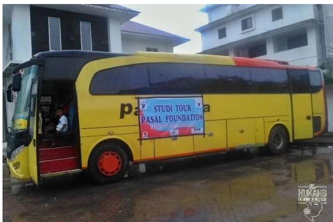
Autobus pro výlet dětí do Zoo Siantar

Pro děti z naší školy a jejich rodiče jsme pod vedením koordinátorky osvěty a vzdělávání Novi a asistentek Syfi a Yanti uspořádali výlet do Zoo Siantar. Vypravili jsme celý autobus a výletu se zúčastnilo 51 lidí (31 dětí, 16 rodičů a 4 členové indonéského Kukang týmu). Děti se o zvířatech v zoo a jejich ohrožení učily zábavnou formou, zapisovaly si zajímavosti a hrály různé hry o sladké odměny.