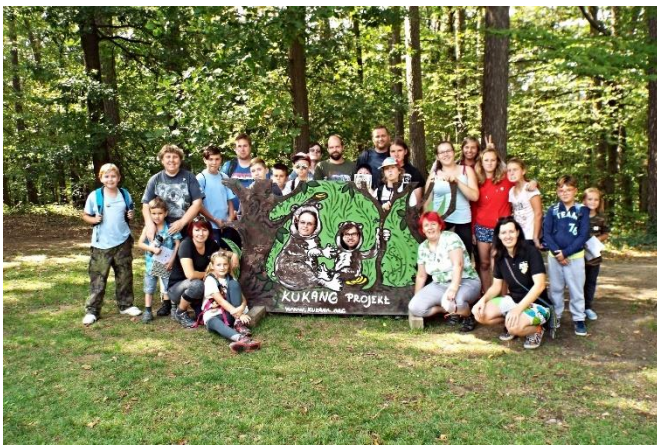
Den pro outloně váhavé v Zoo Olomouc

V Zoo Olomouc byly v několika pavilonech nainstalovány nové televize, kde jsou ve smyčce promítána videa o záchranném programu Kukang. Stejná videa jsou promítána také na obrazovkách v areálu Zoo Ostrava.