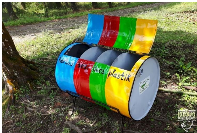
Odpadkový koš na třídění odpad