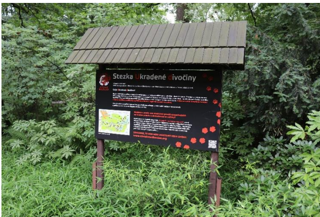
Stežka Ukradené divočiny v Zoo Ostrava

Lucie Čižmářová a její série krvavých fotografií ke kampani Ukradená divočina získaly cenu "Honorable Mention 2018" ve významné celosvětové fotografické soutěži International Photography Awards (IPA). Oceněné fotografie a jejich příběh jsou k vidění zde .