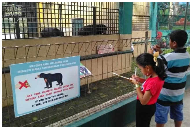
Výuka dětí z anglicko-environmentální školy v Zoo Siantar

Každý rok 17. srpna slaví celá Indonésie Den nezávislosti. Záchranný program Kukang se do oslav pravidelně zapojuje různou formou. V roce 2018 děti z naší anglicko-environmentální školy slavily společně s jejich učitelkami, které jim nachystaly zábavné aktivity, v rámci kterých se děti věnovaly i ochraně přírody.