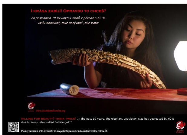
Ukradená divočina, nekrvavá verze – slonovina

Tiskové konference pořádané dne 26. června v Zoo Ostrava při příležitosti oficiálního spuštění kampaně se zúčastnilo několik novinářů z České televize, ČTK, Českého rozhlasu, MS Deníku a Práva. Výrazná byla také následující mediální odezva, kdy vzniklo několik reportáží v České televizi: