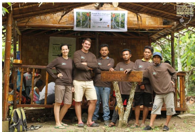
Indonéský terénní Kukang tým