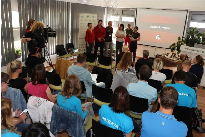
Tisková konference k oficiálnímu spuštění kampaně

Významným mediálním výstupem byla zmínka o UD ve FLASH NEWS Světové asociace zoologických zahrad a akvárií (WAZA) a také na facebookových stránkách WAZY.