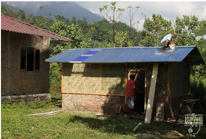
Stavba skladu materiálu