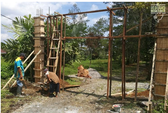
Základy stavby vjezdové brány

V roce 2018 se záchrané a rehabilitační centrum programu rozšířilo o několik nových staveb. Byla postavena nová vjezdová brána, malá budova pro ochranku a celé záchrané centrum bylo za účelem lepšího zabezpečení oploceno pomocí 1,5 m vysoké sítě. V karanténní části záchraného centra byla postavena nová vrata, čímž se tato část pozemku uzavřela a nebude přístupna pro veřejnost. Postaven byl nový, větší sklad materiálu a vybavení. Dále proběhly rekonstrukční práce na poškozených částech centra, oprava poničeného plotu, výměna listové střechy karantény pro outloně a zabezpečení hmyzí farmy proti dešti.