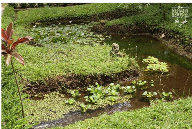
Odvodňovací a biodiverzitní jezírko

V centru byl dále zaveden nový systém redukce a třídění odpadu a byla rozšířena a zdokonalena odchovna hmyzu.