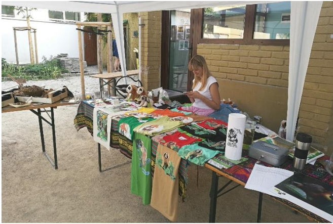
Kukang stánek na benefiči Sumatra v ohrožení