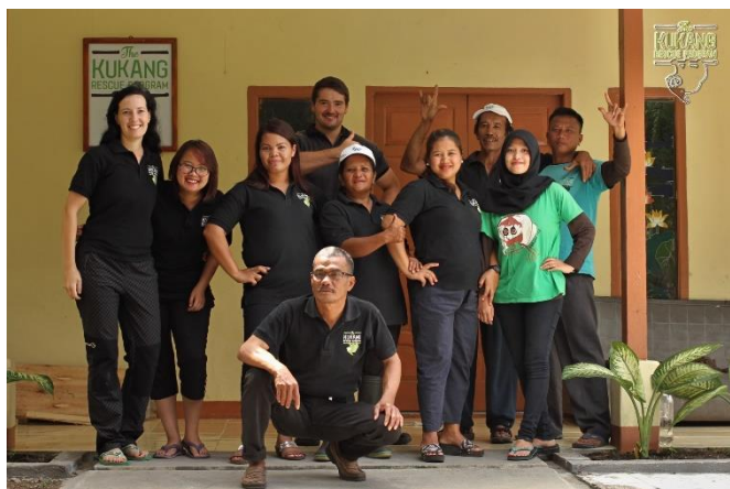
Indonéský Kukang tým v záchranném centru

Stejně jako zatím každý rok se nám povedlo do našeho Kukang týmu přijmout nové členy ať už na Sumatře, nebo v Evropě. Indonéský tým odvádí dobrou práci a je pravidelně podporován prací početného skvělého týmu převážně z České republiky, ale také z dalších evropských zemí. Jedním z hlavních cílů záchranného programu Kukang je vybudování indonéského týmu, který bude řešit většinu ochrannářských aktivit spojených s outloni a dalšími zvířaty. Jak tento indonéský Kukang tým vypadal v roce 2018, se můžete podívat na příložených fotografiích.